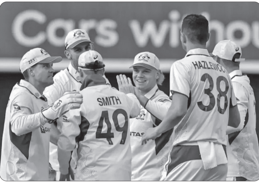
2027 ODI વર્લ્ડ કપ માટે તૈયારી શરૂ. પાકિસ્તાન અને ઓસ્ટ્રેલિયા વચ્ચે આમહિનાના અંતમાં ત્રણ મેચની ODI સીરિઝ શરૂ થવાની છે. પહેલી મેચ 30 મેના રોજ રમાશે. એવું માનવામાં આવે છે કે આ સીરિઝ 2027 ODI વર્લ્ડ કપ માટે ઓસ્ટ્રેલિયાની તૈયારીઓની શરૂઆત કરશે. આ પછી, ઓસ્ટ્રેલિયન ટીમ બાંગ્લાદેશનો પ્રવાસ કરશે, જ્યાં ત્રણ ODI અને ત્રણ T20 આંતરરાષ્ટ્રીય મેચોની સીરિઝ રમાશે.

ક્રિકેટ ઓસ્ટ્રેલિયાએ પાકિસ્તાન સામેની ત્રણ મેચની ODI સીરિઝ માટે ટીમની જાહેરાત કરી છે. ટીમના ત્રણ ફાસ્ટ બોલરોને બાકાત રાખવામાં આવ્યા છે. ઉલ્લેખનીય છે કે, પેટ કમિન્સ, મિશેલ સ્ટાર્ક અને જોશ હેઝલવુડ ટીમમાંથી બહાર થયા છે. પરિણામે કેટલાક યુવા અને નવા ખેલાડીઓને તક આપવામાં આવી છે. ઓસ્ટ્રેલિયાએ ટીમમાં ઓછા રેંડેડ ખેલાડીઓ લિયામ સ્કોટ અને ઓલી પીડનો સમાવેશ કર્યો છે. કેટલાક ભૂલી ગયેલા ખેલાડીઓનો પણ સમાવેશ કરવામાં આવ્યો છે.