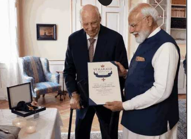
આ પહેલા તેઓ છઠ્ઠી, નેધરલેન્ડ અને સ્વીડનની મુલાકાત લઈ ચુક્યા છે. આ પછી તેઓ ઈટાલી જશે. નોર્વેમાં મોદીએ કહ્યું કે પશ્ચિમ એશિયા અને યુકેન જેવા સંઘર્ષોનો

અને નોર્વે બંને નિયમ આધારિત વ્યવસ્થા, વાતચીત અને કૂટનીતિમાં વિશ્વાસ રાખે છે. ભલે યુકેનનો મુદ્દો હોય કે પશ્ચિમ એશિયાનો, ભારત શાંતિ અને જલ્દી સંઘર્ષ સમાપ્ત કરાવવાના દરેક પ્રયાસને સમર્થન આપતું રહેશે. મોદીએ વૈશ્વિક સંસ્થાઓમાં સુધારાની જરૂરિયાત પર પણ ભાર મૂક્યો. તેમણે કહ્યું કે દુનિયાની વધતી જતી પડકારોનો સામનો કરવા માટે આંતરરાષ્ટ્રીય સંસ્થાઓમાં ફેરફાર જરૂરી છે. તેમણે આંતરકવાદના મુદ્દાનો પણ ઉલ્લેખ કર્યો અને કહ્યું કે દરેક પ્રકારના આંતરકવાદને જડમૂળથી ખતમ કરવો એ ભારત અને નોર્વેની સહિયારી પ્રતિબદ્ધતા છે. પ્રધાનમંત્રી મોદીએ ગયા વર્ષે પહેલગામ આતંકી હુમલા પછી ભારતને સમર્થન આપવા બદલ