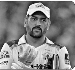
ધોનીને નિવૃત્તિ જાહેર કરશે. કેફના આ નિવેદન બાદ સોશિયલ મીડિયા પર "Thank You Dhoni" અને "Last Dance at Chepauk" જેવા હેશટેગ ટ્રેન્ડ થવા લાગ્યા છે. આ દરમિયાન, ધોનીના સૌથી નજીકના મિત્ર અને પૂર્વ CSK સ્ટાર સુરેશ રૈના પણ ચેન્નાઈ પહોંચ્યા હોવાના અહેવાલો સામે આવ્યા છે. કહેવાઈ રહ્યું છે કે રૈના આ ખાસ ક્ષણનો ભાગ બનવા માટે યેપોકમાં હાજર રહી શકે છે. આ સમાચાર પછી ધોનીની નિવૃત્તિ અંગેની ચર્ચાઓ વધુ વેગવંતી બની ગઈ છે. જો ખરેખર ધોની આ મેચ બાદ IPLમાંથી નિવૃત્તિ લે છે, તો યેપોક સ્ટેડિયમમાં એક ભાવુક અને ઐતિહાસિક ક્ષણ જોવા મળી શકે છે, કારણ કે કરોડો યાહકો માટે ધોની માત્ર ખેલાડી નહીં પરંતુ એક લાગણી છે.

IPL 2026માં ચેન્નાઈ સુપર કિંગ્સ અને સનરાઈઝર્સ હૈદરાબાદ વચ્ચે યેપોક સ્ટેડિયમમાં મહત્વપૂર્ણ મેચ રમાવાની છે. પરંતુ આ મેચ માત્ર બે ટીમો વચ્ચેની નથી, પરંતુ મહાદ્દ સિંહ ધોનીના IPL કરિયરની છેલ્લી મેચ બની શકે છે તેવી ચર્ચાઓએ ક્રિકેટ જગતમાં ઉત્સુકતા વધારી દીધી છે. યાહકોમાં સૌથી મોટો સવાલ એ છે કે શું "થાલા" હવે પોતાના યાહકોને અંતિમ સલામ આપશે? જોકે હજુ સુધી ધોની કે CSK તરફથી કોઈ સત્તાવાર જાહેરાત કરવામાં આવી નથી, પરંતુ મેચ પહેલા બનેલી કેટલીક ઘટનાઓ નિવૃત્તિ તરફ ઈશારો કરી રહી છે. ધોનીએ વર્ષ 2021 દરમિયાન CSKના એક કાર્યક્રમમાં પોતાના ભવિષ્ય વિશે વાત કરતાં કહ્યું હતું કે તે હંમેશા આયોજન સાથે ક્રિકેટ રમે છે. તેણે કહ્યું હતું કે તેણે પોતાની છેલ્લી ODI રાંચીમાં રમી હતી અને તેની ઈચ્છા છે કે પોતાની છેલ્લી T20 મેચ ચેન્નાઈમાં રમે. હવે આ વાતને 5 વર્ષ વીતી ગયા છે અને IPL 2026માં યેપોક પર રમાનારી આ મેચ CSK માટે હોમ ગ્રાઉન્ડ પરની છેલ્લી મેચ છે. તેથી યાહકો હવે માનવા લાગ્યા છે કે કદાચ ધોની હવે પોતાની જ કહેલી વાતને સાકાર કરશે. SRM સામેની મેચ પહેલા ધોનીને યેપોકના નેટ સેશનમાં લાંબા સમય સુધી મહેનત કરતા જોવામાં આવ્યો હતો. સોશિયલ મીડિયા પર