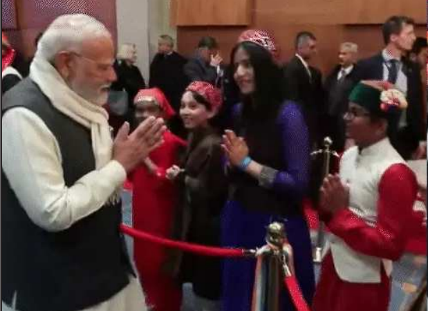
વખત ૨૦૧૮માં સ્ટોકહોમ અને બીજી વખત ૨૦૨૨માં કોપનહેગનમાં યોજાઈ હતી. આ વખતે બેઠકમાં ગ્રીન એનર્જી, ડિજિટલાઈઝેશન, રક્ષા સહયોગ,

નોર્વે, તા. ૧૮ નોર્વેએ પીએમ મોદીને તેમના સર્વોચ્ચ સન્માન 'ગ્રાન્ડ ક્રોસ ઓફ ધ રોયલ નોર્વેજીયન ઓર્ડર ઓફ મેરિટ'થી સન્માનિત કર્યા છે. આ નોર્વેનું સૌથી મોટું સન્માન માનવામાં આવે છે. આ વડાપ્રધાન નરેન્દ્ર મોદીને મળેલું ૩૨મું આંતરરાષ્ટ્રીય સન્માન છે. આ પહેલા ગઈકાલે સ્વીડનને પણ તેમને પોતાના સર્વોચ્ચ સન્માનથી સન્માનિત કર્યા હતા. આ પહેલા પીએમ મોદીએ નોર્વેની રાજધાની ઓસ્લોમાં નોર્વેનું મેડાલ યોનાસ સ્ટોર સાથે સંયુક્ત પ્રેસ કોન્ફરન્સ કરી હતી. આ દરમિયાન તેમણે કહ્યું કે ગયા વર્ષે ભારત અને યુરોપિયન ફ્રી ટ્રેડ એસોસિએશન (EFTA) દેશો વચ્ચે