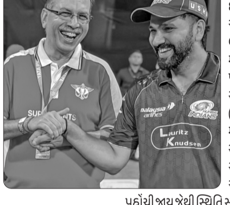
પહોંચી જાય જેથી સ્થિતિ સ્પષ્ટ બને. હાલ સૌથી મોટી ચિંતા રોયલ ચેલેન્જર્સ બેંગલુરુ અને ગુજરાત ટાઈટન્સ છે જેમના 12-12 પોઈન્ટ છે. મુંબઈ ઈન્ડિયન્સ કે આ બંને ટીમો પોતાની આવનારી મેચ હારે, જેથી તેમની પ્લેઓફની આશા ચાલુ રહી શકે.

ટીમના ફેન્સમાં નિરાશા છે. ઘણા ફેન્સ આશા રાખી રહ્યા છે કે કોઈ રીતે રોહિત શર્માને ટીમમાં લાવવામાં આવે. તેમનું માનવું છે કે જો રોહિત શર્મા કેપ્ટન બને તો ટીમ મજબૂત બની શકે છે અને ટ્રોફી જીતવાનું સપનું પણ પૂરું થઈ શકે છે.