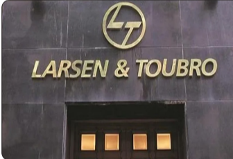
LARSEN & TOUBRO

કાર્યક્ષેત્રમાં મૂળભૂત ડિઝાઈન, વિગતવાર ઇજનેરી, પ્રાપ્તિ અને બાંધકામ, એકંદર પ્રોજેક્ટ મેનેજમેન્ટ અને પ્લાન્ટ અને તેની સુવિધાઓનું અંતિમ હસ્તાંતરણ શામેલ છે.