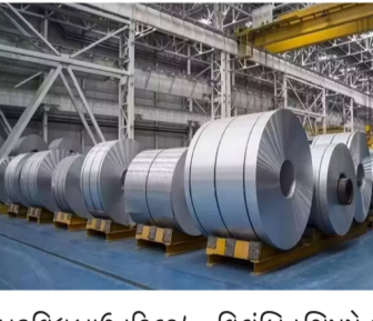
વિલંબિત શિપમેન્ટને કારણે વિક્ષેપો જોવા મળશે તેવી અપેક્ષા રાખે છે.

વિલંબિત શિપમેન્ટને કારણે વિક્ષેપો જોવા મળશે તેવી અપેક્ષા રાખે છે. બ્રોકરેજ ફર્મ નોમુરાએ શેર પર તેનું રેટિંગ ડાઉનગ્રેડ કર્યું છે, જે HSBC એ તેના ચોથા ક્વાર્ટરના કમાણી પછી તેના ભાવ લક્ષ્યાંક ઘટાડો કર્યો છે. L&T ના શેર સવારે 10.05 વાગ્યે 3.3% ઘટીને ₹3,919.2 પ્રતિ શેર પર ટ્રેડ થઈ રહ્યા હતા. ગયા મહિનામાં શેર 5% વધ્યો છે અને આ વર્ષે અત્યાર સુધીમાં 5.3% ઘટ્યો છે.