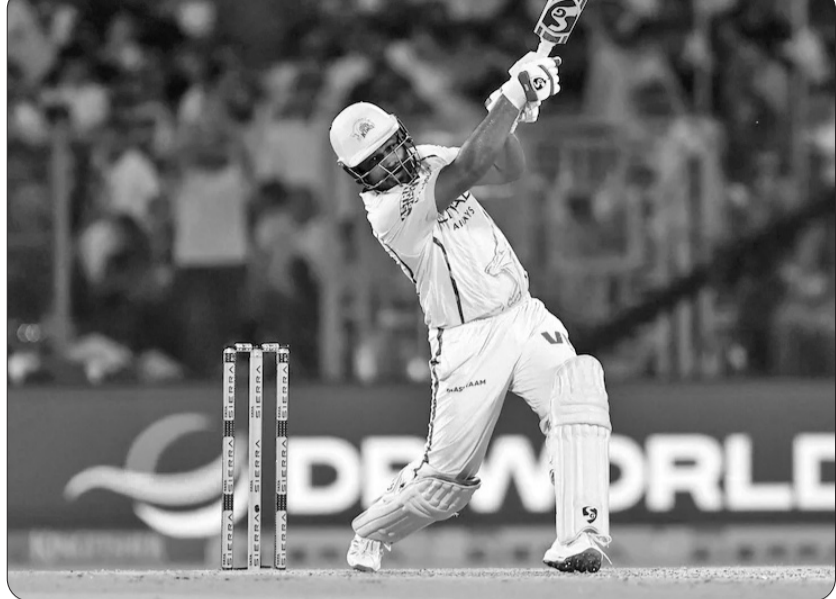
નજીક છે, પરંતુ તેને ટોચના સ્થાને પહોંચવામાં થોડો સમય લાગશે. વિરાટ કોહલી 306 છગ્ગા સાથે ત્રીજા ક્રમે છે. એમએસ ધોનીએ અત્યાર સુધી 264 છગ્ગા ફટકાર્યાં છે. ધોનીએ આ વર્ષે એક પણ મેચ સમય લાગશે. વિરાટ કોહલી 306 છગ્ગા સાથે રમી નથી, નહીં તો તેણે વધુ છગ્ગા ફટકાર્યાં હોત. એબી ડી વિલિયર્સ 251 છગ્ગા સાથે પાંચમા ક્રમે

સંજુ સેમસન હાલમાં જબરદસ્ત ફોર્મમાં છે. તેણે દિલ્હી કેપિટલ્સ સામે એક શક્તિશાળી ઈનિંગ રમી. ભલે તે પોતાની સદી પૂર્ણ કરી શક્યો હોત, પરંતુ તેણે ટીમ માટે તેનો ભોગ આપ્યો. તેણે મેચ દરમિયાન કુલ છ છગ્ગા ફટકાર્યાં. આ સાથે સંજુએ ડેવિડ વોર્નરને પાછળ છોડી દીધો. આવનારી મેચોમાં તે એબી ડી વિલિયર્સને પણ પાછળ છોડી દે તો નવાઈ નહીં. આઈપીએલમાં દિલ્હી કેપિટલ્સ વિરુદ્ધ ચેન્નાઈ સુપર કિંગ્સ મેચમાં સંજુ સેમસનએ 52 બોલમાં 87 રન બનાવ્યા. તેણે સાત ચોગ્ગા અને છ છગ્ગા ફટકાર્યાં. તે અંત સુધી અણનમ રહ્યો અને તેની ટીમને વિજય અપાવ્યો. આ સાથે, સેમસન હવે આઈપીએલ ઇતિહાસમાં સૌથી વધુ છગ્ગા મારનારા બેટ્સમેનોની યાદીમાં છઠ્ઠા સ્થાને પહોંચી ગયો છે. ઈન્ડિયન પ્રીમિયર લીગના ઇતિહાસમાં સૌથી વધુ છગ્ગા મારવાનો રેકોર્ડ ક્રિસ ગેલના નામે છે. તેણે 357 છગ્ગા ફટકાર્યાં છે. તે હવે આઈપીએલમાંથી નિવૃત્ત થઈ ગયો છે. રોહિત શર્મા 317 છગ્ગા સાથે બીજા ક્રમે છે. રોહિત ગેલનો રેકોર્ડ તોડવાની સૌથી