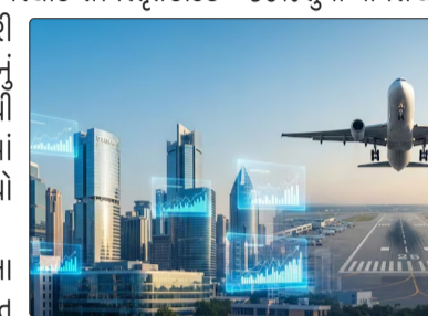
મોરેટોરિયમ સાથે સાત વર્ષનો સમયગાળો મળશે.

મોરેટોરિયમ સાથે સાત વર્ષનો સમયગાળો મળશે. બ્રોકરેજ ફર્મ B&K સિક્યોરિટીઝ ઇન્ડિયા આ પગલાને બેંકો અને NBFCs માટે ભાવનાત્મક રીતે સકારાત્મક માને છે, કારણ કે જાહેર ક્ષેત્રની બેંકોએ ઐતિહાસિક રીતે અગાઉની ECLGS યોજનાઓ હેઠળ વિતરણમાં પ્રભુત્વ મેળવ્યું છે.