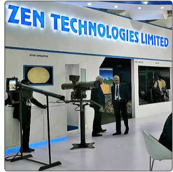
ZEN TECHNOLOGIES LIMITED

ઝેન ટેકનોલોજીઝે જણાવ્યું હતું કે સિસ્ટમમાં નાના લો-રિફ્લેક્ટિવ ડ્રોનને શોધવા માટે 20 કિમી સુધીની રેન્જ સાથે સ્વદેશી રડાર પણ શામેલ છે. પ્લેટફોર્મના